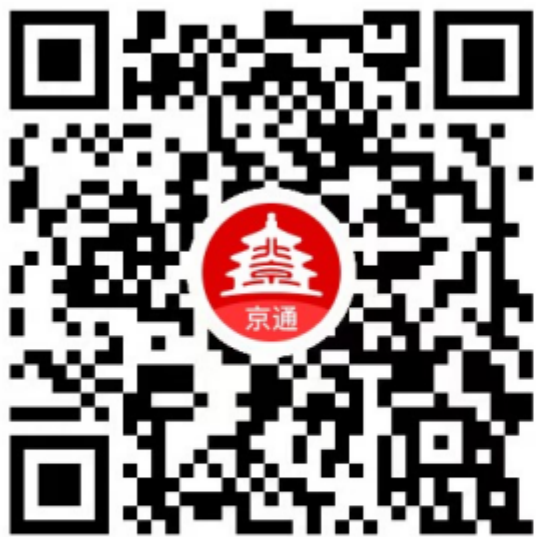
微信端小程序二维码