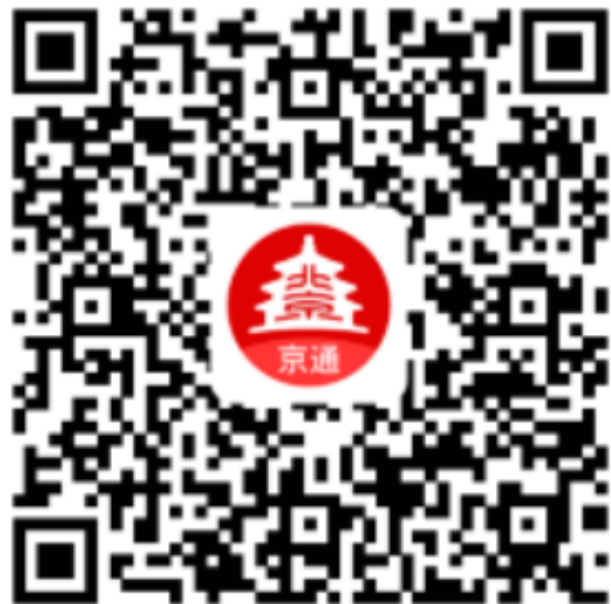
支付宝端小程序二维码