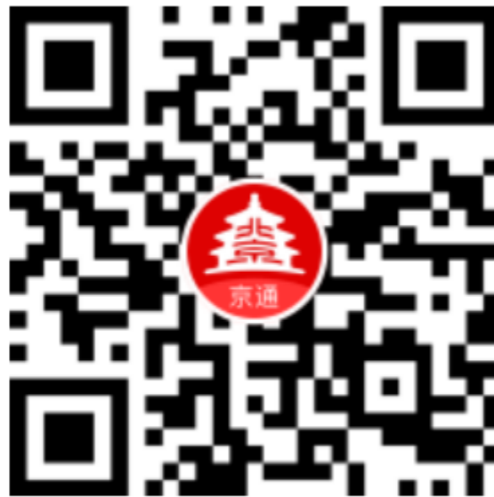
百度端小程序二维码